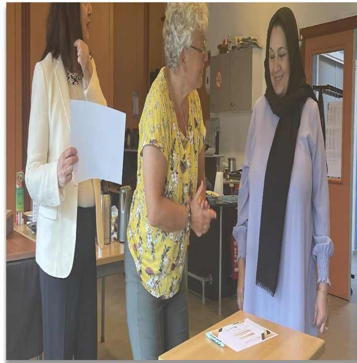
Penningmeester & boekhouding